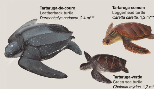
Tartaruga-de-couro Leatherback turtle Dermochelys coriacea . 2,4 m***