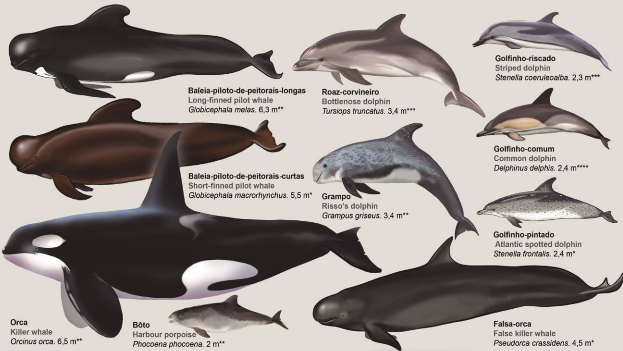
Baleia-piloto-de-peitorais-longas Long-finned pilot whale Globicephala melas . 6,3 m**